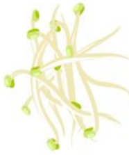
Germe de Soja